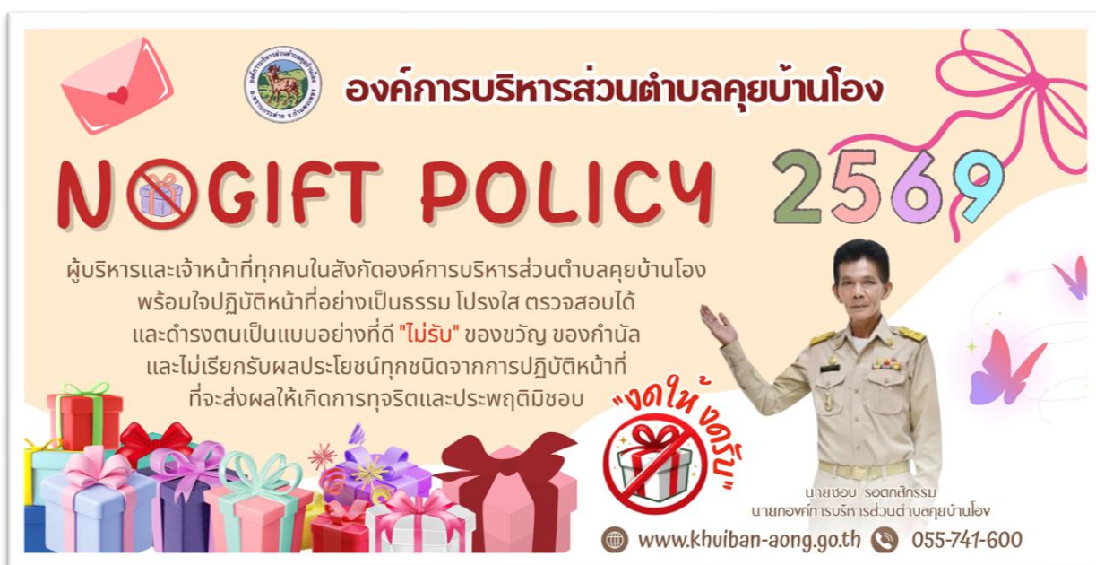
ภาพประกอบ ข้อ ๒.๓