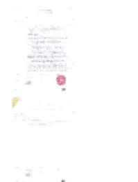
รายการที่ 2: ผู้แจ้ง