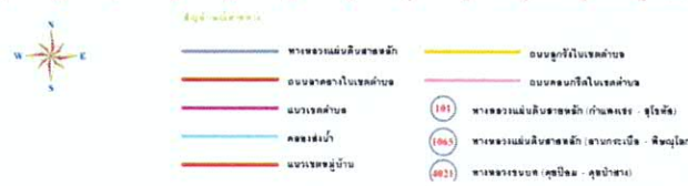
แผนที่หมู่บ้านตำบลคุยบ้านโอง อำเภอพราณกระต่าย จังหวัดกำแพงเพชร