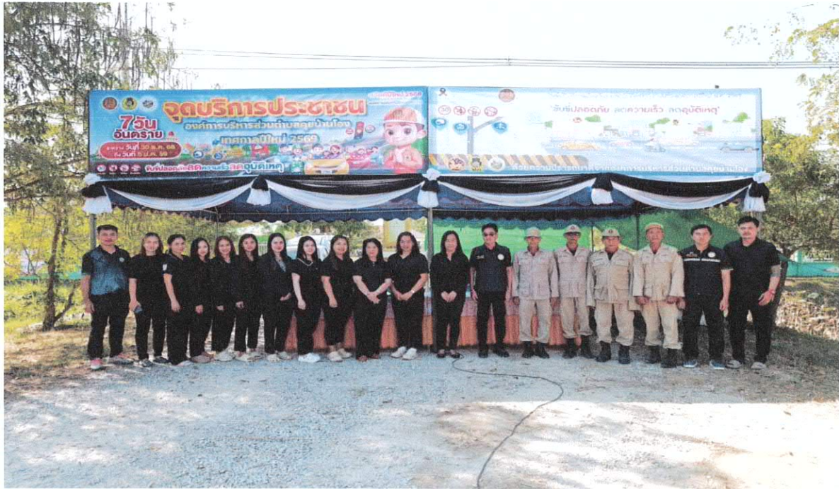
ภาพถ่าย อปพร.ปฏิบัติหน้าที่ประจำจุดบริการประชาชน องค์การบริหารส่วนตำบลคุดขุยบ้านโอง ช่วงเทศกาลปีใหม่ พ.ศ. ๒๕๖๙