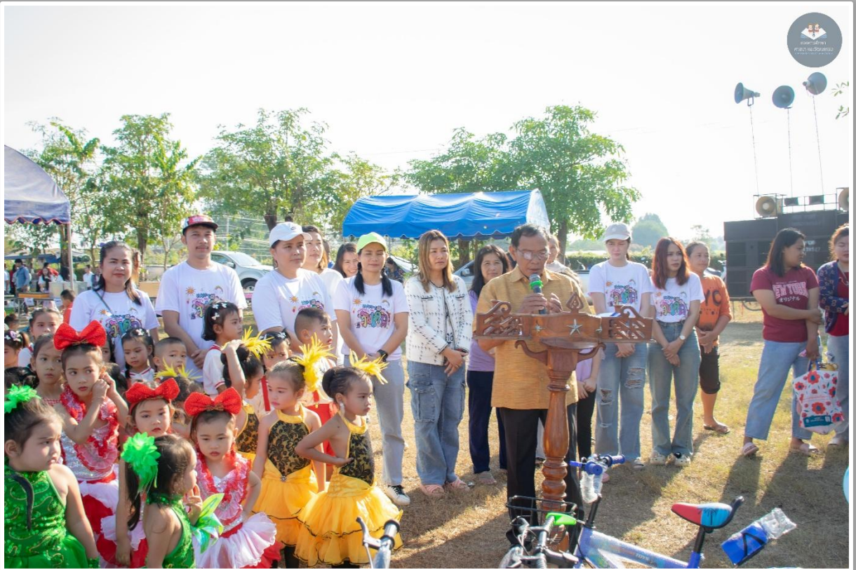
ภาพประกอบการดำเนินโครงการจัดงานวันเด็กแห่งชาติ ประจำปี ๒๕๖๘