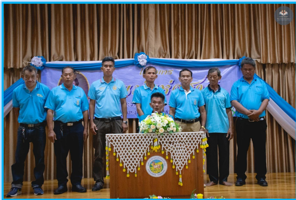
ภาพประกอบการดำเนินโครงการจัดงานวันแม่แห่งชาติ ประจำปี ๒๕๖๘