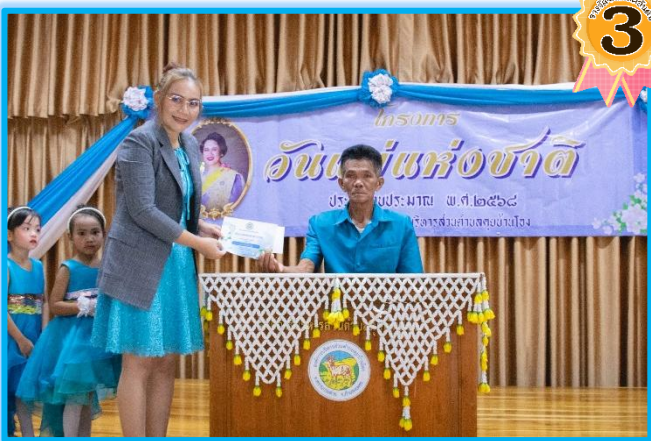
ระดับอนุบาล ๑