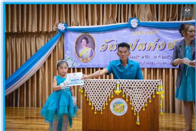
ระดับอนุบาล ๒