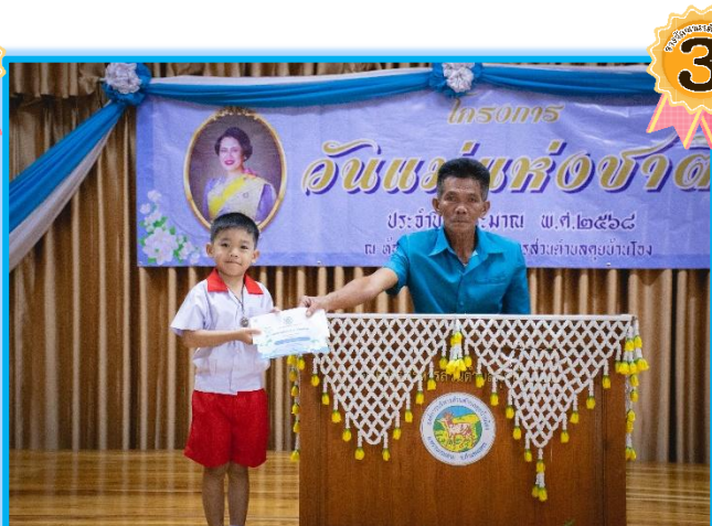
ระดับอนุบาล ๓