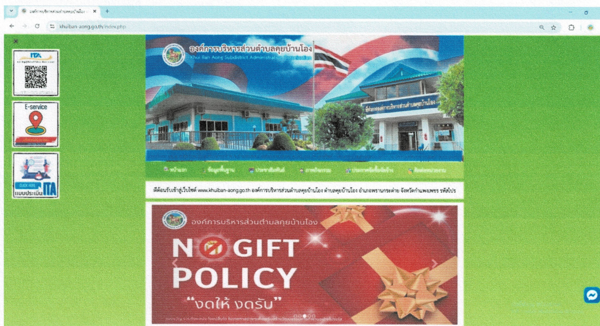
ภาพประกอบ ข้อ ๒.๓