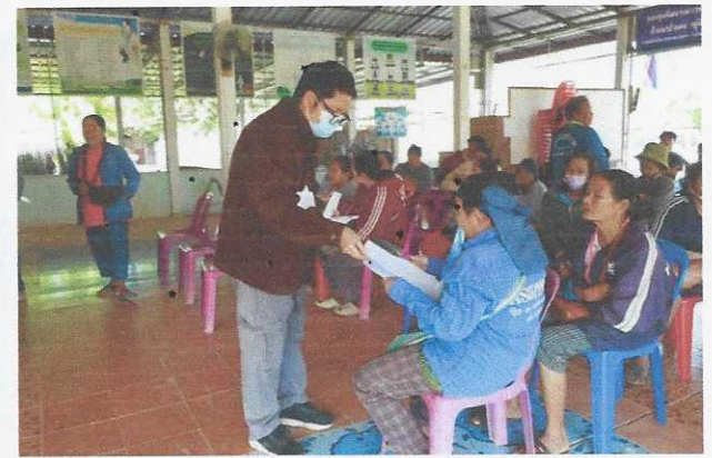
ภาพประกอบ : ประชาชนหมู่ที่ ๑ บ้านนาป่าแดง เข้าร่วมทำประชาพิจารณ์ฯ