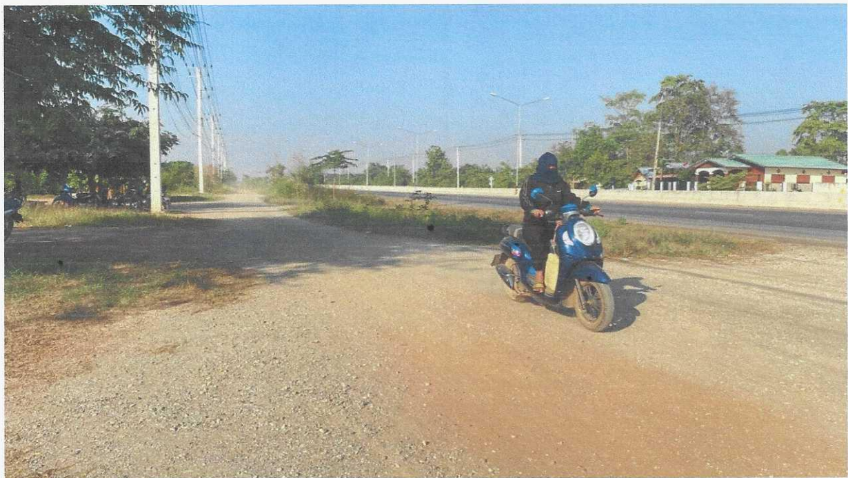
ภาพประกอบ : ภาพพื้นที่บริเวณถนนทางคู่ขนานบ้านนาป่าแดง เวลาที่มีรถวิ่งผ่านจะมีฝุ่นจำนวนมากปลิว เข้าบ้านประชาชนทั้งสองฝั่ง