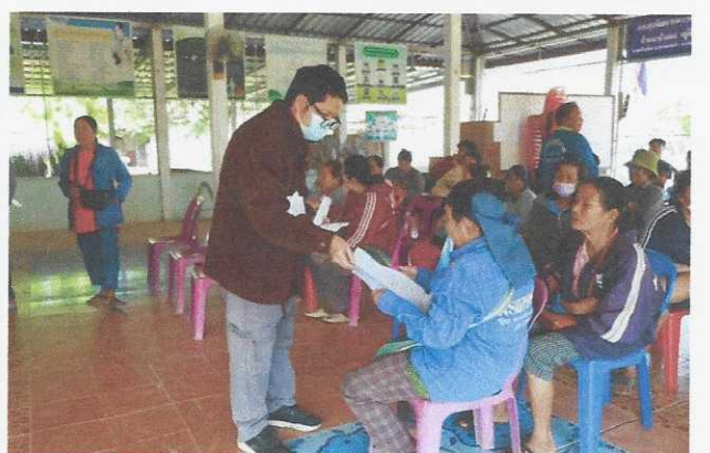
ภาพประกอบ : ประชาชนหมู่ที่ ๑ บ้านนาป่าแดง เข้าร่วมทำประชาพิจารณ์ฯ