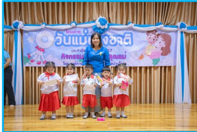
ระดับเตรียมอนุบาล ศพด.คุยบ้านไอง