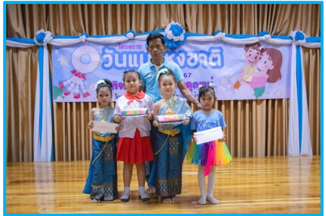
ระดับอนุบาล ๓ ศพด. คุ้ยบ้านโอง