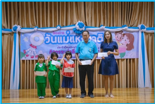
ระดับอนุบาล โรงเรียนสังกัด สพฐ.