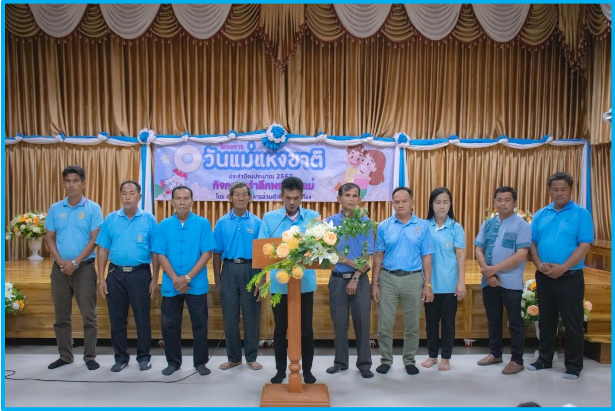
ภาพประกอบการดำเนินโครงการจัดงานวันแม่แห่งชาติ ประจำปี ๒๕๖๗