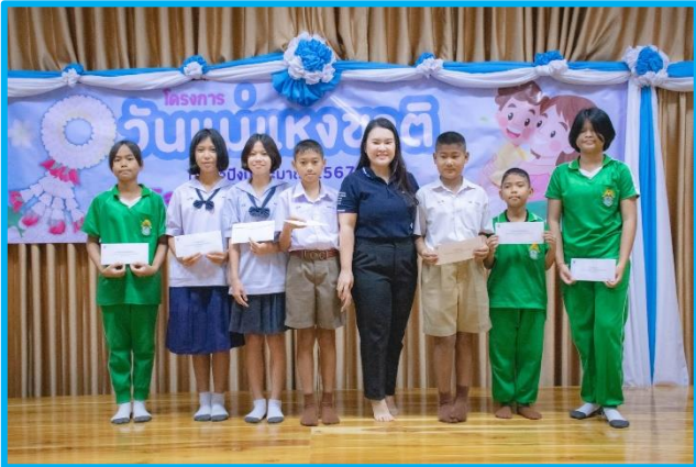
ระดับประถมปลาย ป.๑ - ๓ โรงเรียนสังกัด สพฐ.