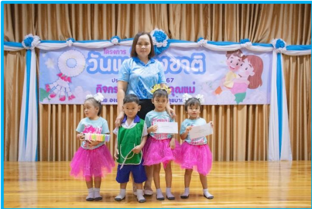
ระดับอนุบาล ศพด.บ้านคุยแฉวน