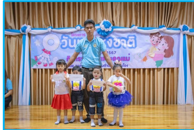
ระดับอนุบาล ๑ ศพด. คุยบ้านไอง