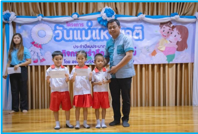
ระดับอนุบาล ๒ ศพด. คุ้ยบ้านโอง