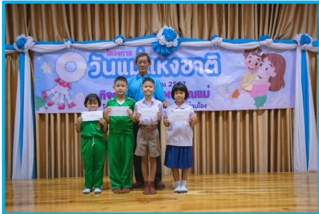
ระดับประถมต้น ป.๑ - ๓ โรงเรียนสังกัด สพฐ.