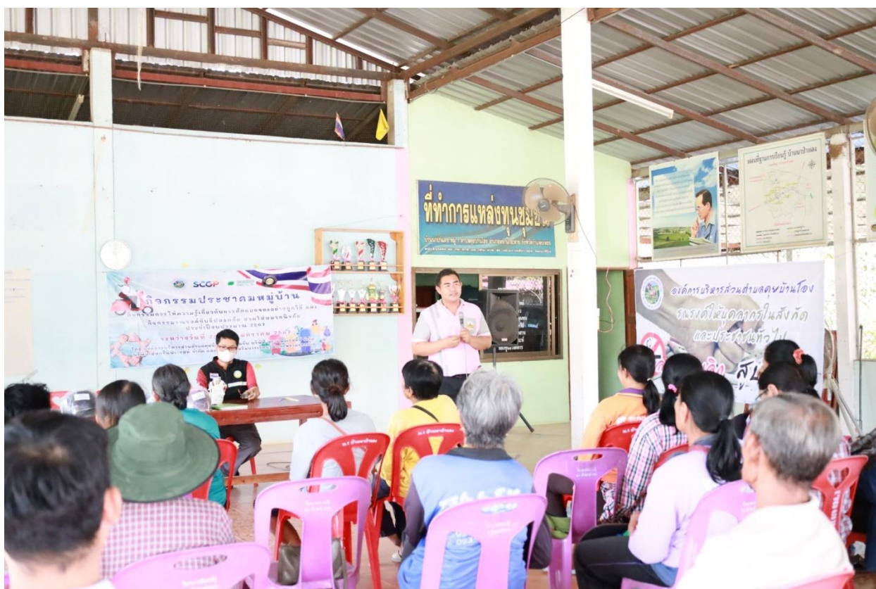
ภาพประกอบ กิจกรรมเวทีประชามหมู่บ้าน ประจำปีงบประมาณ พ.ศ.๒๕๖๗