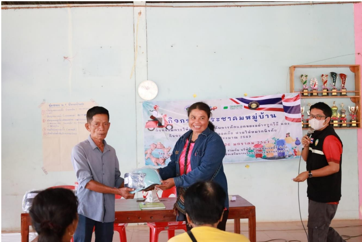
กิจกรรมรณรงค์ขับขี่ปลอดภัย สวมใส่หมวกนิรภัย ประจำปีงบประมาณ พ.ศ.๒๕๖๗