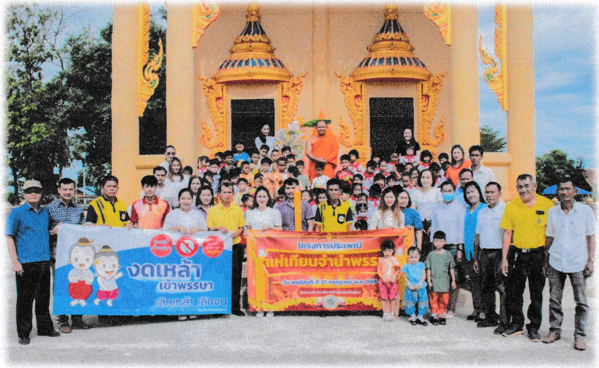
ภาพประกอบการดำเนินโครงการประเพณีแห่เทียนจำนำพรรษา ประจำปีงบประมาณ พ.ศ. ๒๕๖๖