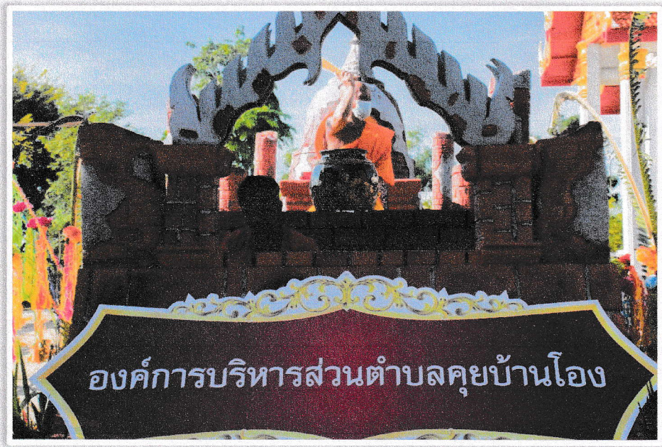
องค์การบริหารส่วนตำบลคุยบ้านโอง