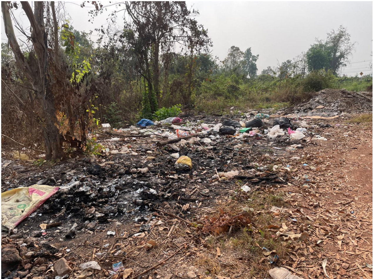
สภาพพื้นที่บริเวณ หมู่ที่ ๖ เลียบคลองวังเจ้า มีการลักลอบทิ้งขยะเป็นระยะทางกว่า ๕๐๐ เมตร

ด้วยสภาพการเปลี่ยนแปลงในปัจจุบันที่ประชาชนสามารถเข้าถึงความสะดวกสบายต่างๆ ได้ง่ายขึ้น โดยเฉพาะอย่างยิ่งการใช้อุปกรณ์อำนวยความสะดวกต่อชีวิตประจำวัน ที่หลังจากการใช้แล้วจะส่งผลให้เกิดขยะเพิ่มขึ้นโดยอัตโนมัติ โดยหลังจากการลงพื้นที่เพื่อจัดการขยะที่ถูกลักลอบนำมาทิ้งในพื้นที่ของหมู่ที่ ๒ บริเวณถนนสายสะเนา-ไร่แดง และพื้นที่หมู่ที่ ๖ บริเวณสะพานคลองวังเจ้าพบว่า มีการนำขยะหลากหลายประเภทมาทิ้ง อาทิเช่น ขวดแชมพู สบู่เหลว หลอดยาสีฟัน ขวดบรรจุภัณฑ์เคมีเกษตรทั้งแก้วและพลาสติก หรือแม้แต่ผ้าอนามัย แพมเพิสเด็กเล็ก ครก ศาลพระภูมิ เศษวัสดุก่อสร้าง เสื้อผ้า รองเท้า ข้าวสุก ฯลฯ โดยเฉพาะอย่างยิ่งบริเวณคลองวังเจ้าที่มีการลักลอบทิ้งริมถนนเลียบบคลองเป็นระยะทางกว่า ๕๐๐ เมตร ซึ่งยากต่อการแก้ปัญหาในระยะยาว