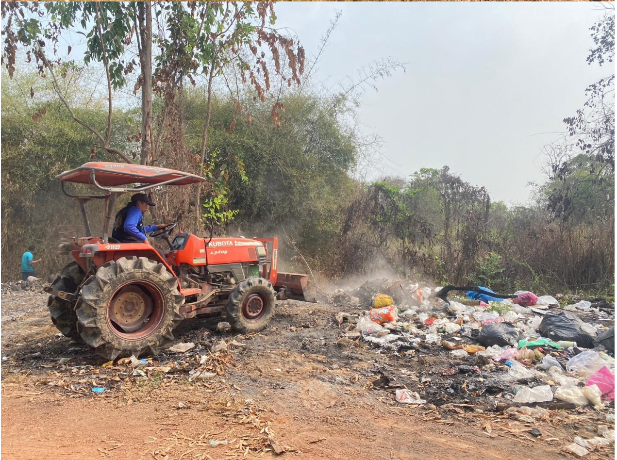
พนักงานของ อบต.คุยบ้านโอง ลงพื้นที่ร่วมกันเก็บขยะและปรับภูมิทัศน์บริเวณสะพานคลองวังเจ้า หมู่ที่ ๖