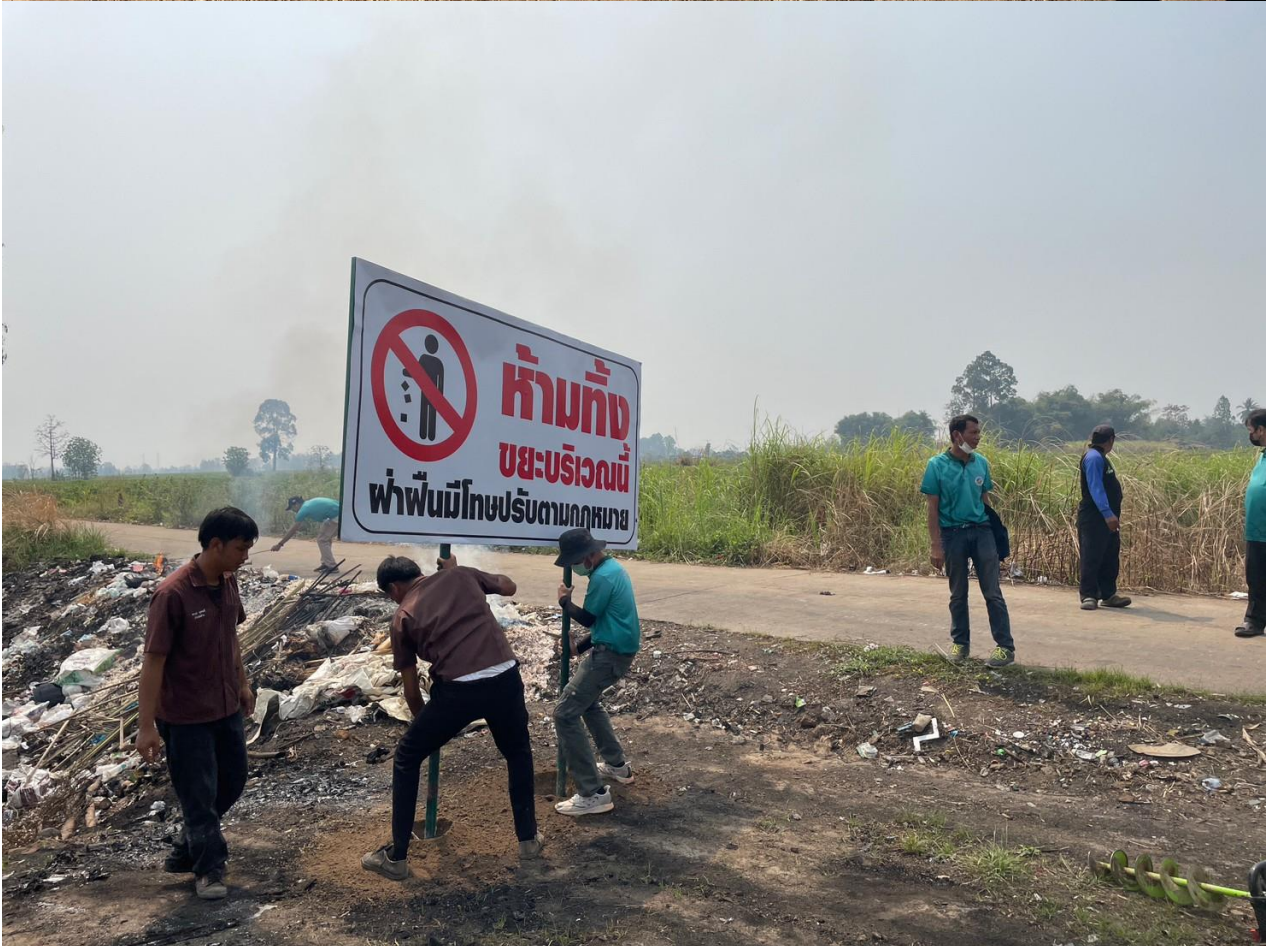
พนักงานของ อบต.คุยบ้านโอง ลงพื้นที่ร่วมกันเก็บขยะและปรับภูมิทัศน์บริเวณถนนสายสะเนา-ไร่ดง หมู่ที่ ๒