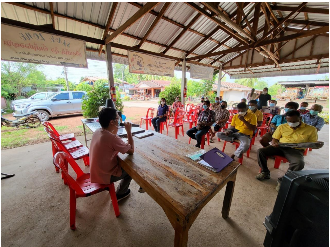
กิจกรรมการจัดการขยะอันตรายตำบลคุยบ้านโอง ประจำปีงบประมาณ พ.ศ.2565