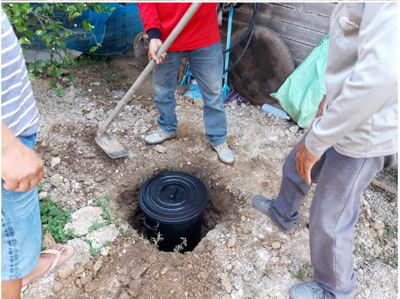
จัดกิจกรรมรณรงค์การจัดทำถังขยะอินทรีย์ (ขยะเปียก) สำหรับครัวเรือน