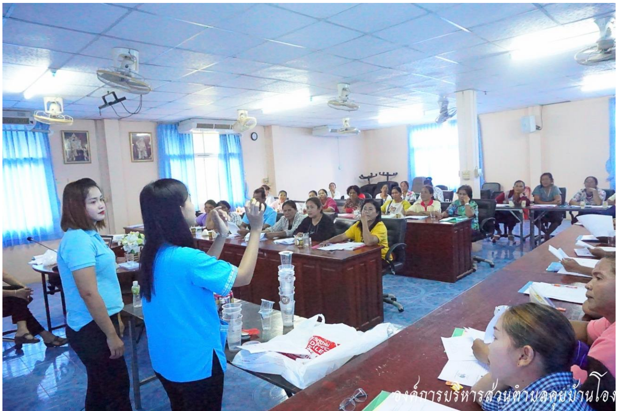
จัดโครงการฝึกอบรมให้ความรู้เกี่ยวกับการคัดแยกขยะอย่างถูกวิธี ประจำปี ๒๕๖๑

องค์การบริหารส่วนตำบลคุยบ้านโอง ได้ให้ความสำคัญกับการจัดการขยะในพื้นที่อย่างต่อเนื่อง โดยได้มีการดำเนินการให้ความรู้ ความเข้าใจกับประชาชนเกี่ยวกับการจัดการขยะอย่างถูกวิธี ตั้งแต่ปี พ.ศ.๒๕๖๑ เริ่มจากการอบรมให้ความรู้กับกลุ่มประชาชนเป้าหมาย ประกอบด้วยผู้นำหมู่บ้าน และผู้สนใจ เข้าร่วมฝึกอบรมให้ความรู้ในการคัดแยกขยะเบื้องต้น จำนวน ๔ หมู่บ้าน และได้ส่งเสริมให้ความรู้ผ่านเครือข่ายออนไลน์ อาทิ เฟสบุ๊ก เว็บไซต์ของ อบต.คุยบ้านโอง