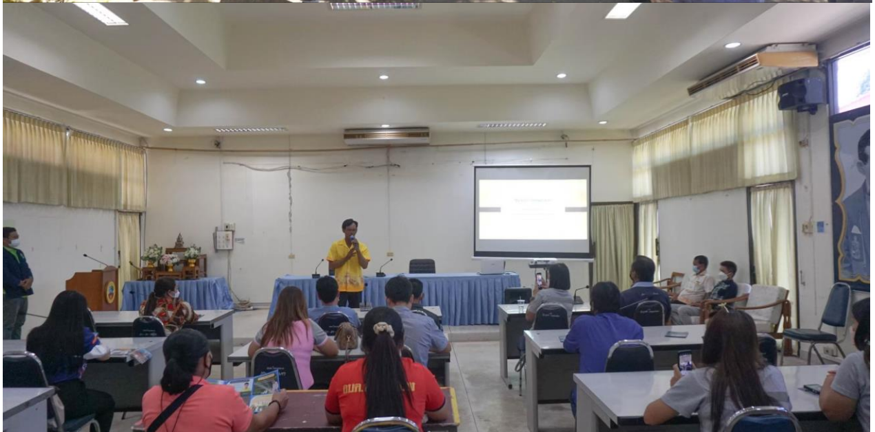
ชุมชนปลอดขยะ (Zero Waste) ปี 2563 ระดับประเทศ ของศูนย์การเรียนรู้ชุมชนบ้านคุดมะม่วง อำเภอลานกระบือ จังหวัดกำแพงเพชร