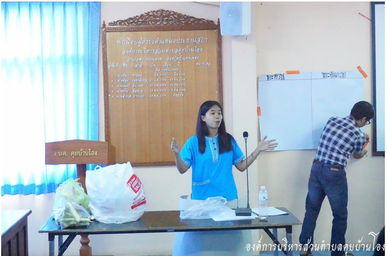
จัดโครงการฝึกอบรมให้ความรู้เกี่ยวกับการคัดแยกขยะอย่างถูกวิธี ประจำปี ๒๕๖๑