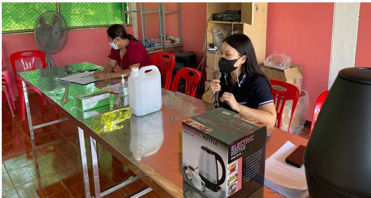
กิจกรรมการจัดการขยะอันตรายตำบลคุดขันธ์ ประจำปีงบประมาณ พ.ศ.2565