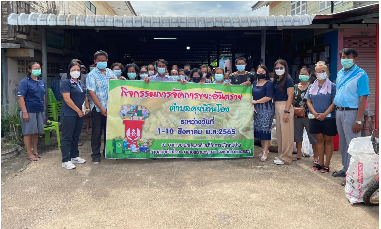
กิจกรรมการจัดการขยะอันตรายตำบลคุดขันธ์ ประจำปีงบประมาณ พ.ศ.2565