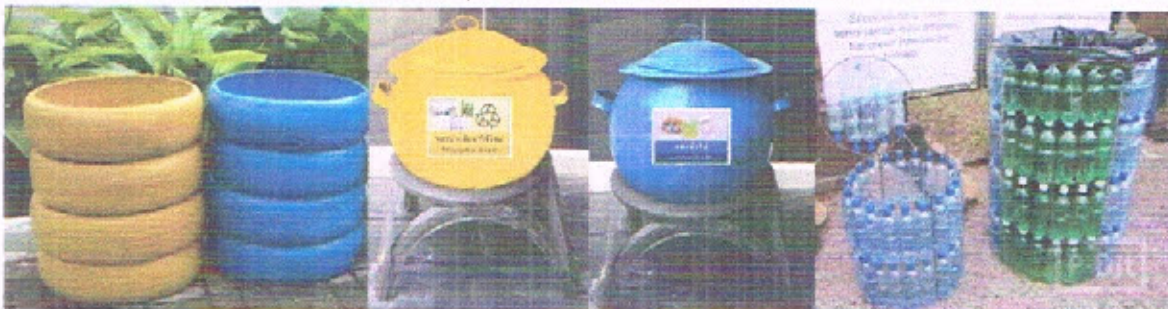
ตัวอย่างถังขยะอินทรีย์

หรืออาจปรับใช้ถังที่เป็นวัสดุในพื้นที่แต่ละท้องถิ่น เช่น ยาง ไม้ ไม้จักรสาน เป็นต้น