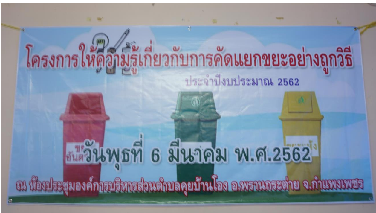
จัดโครงการฝึกอบรมให้ความรู้เกี่ยวกับการคัดแยกขยะอย่างถูกวิธี ประจำปี ๒๕๖๒