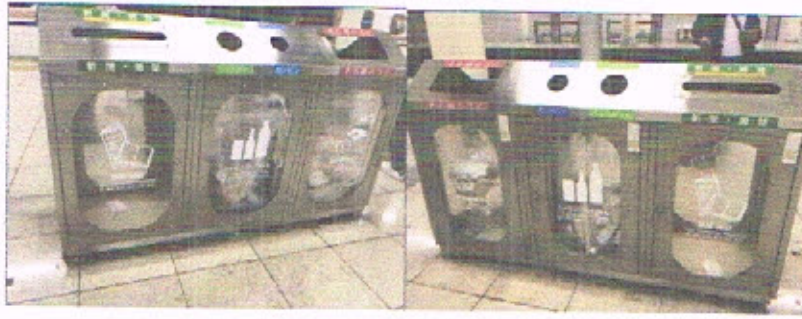
(ตัวอย่าง ถังขยะแยกประเภทของต่างประเทศ)