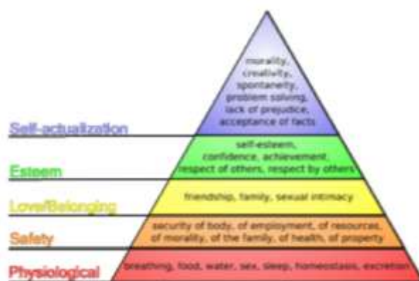
ภาพที่ 2.1 แสดงลำดับความต้องการของมนุษย์ตามแนวคิดของมาสโลว์

ลำดับที่ 1 ความต้องการทางร่างกาย (Physiological Needs) เป็นความต้องการลำดับต่ำสุดและเป็นพื้นฐานของชีวิต เป็นแรงผลักดันทางชีวภาพ เช่น ความต้องการอาหาร น้ำ อากาศ ที่อยู่อาศัย หากพนักงานมีรายได้จากการปฏิบัติงานเพียงพอ ก็จะสามารถดำรงชีวิตอยู่ได้ โดยมีอาหารและที่พักอาศัย เขาก็จะมีกำลังที่จะทำงานต่อไป และการมีสภาพแวดล้อมการทำงานที่เหมาะสม เช่น ความสะอาด ความสว่าง การระบายอากาศที่ดี การบริการสุขภาพ เป็นการสนองความต้องการในลำดับนี้ได้